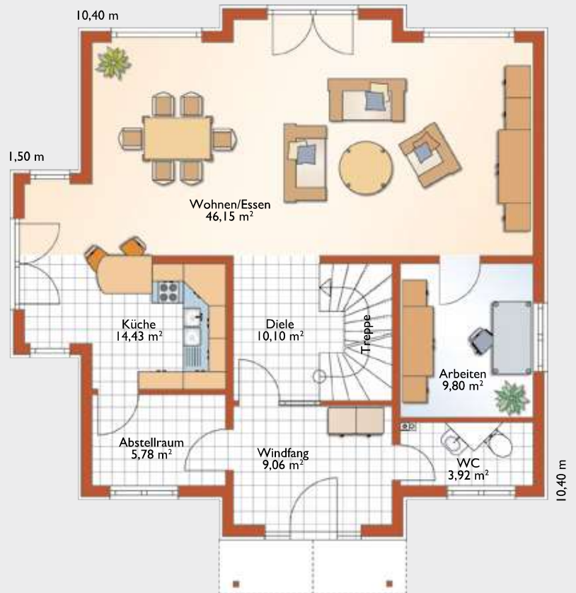
Erdgeschoss. Raumgröße gesamt 99,24 m 2