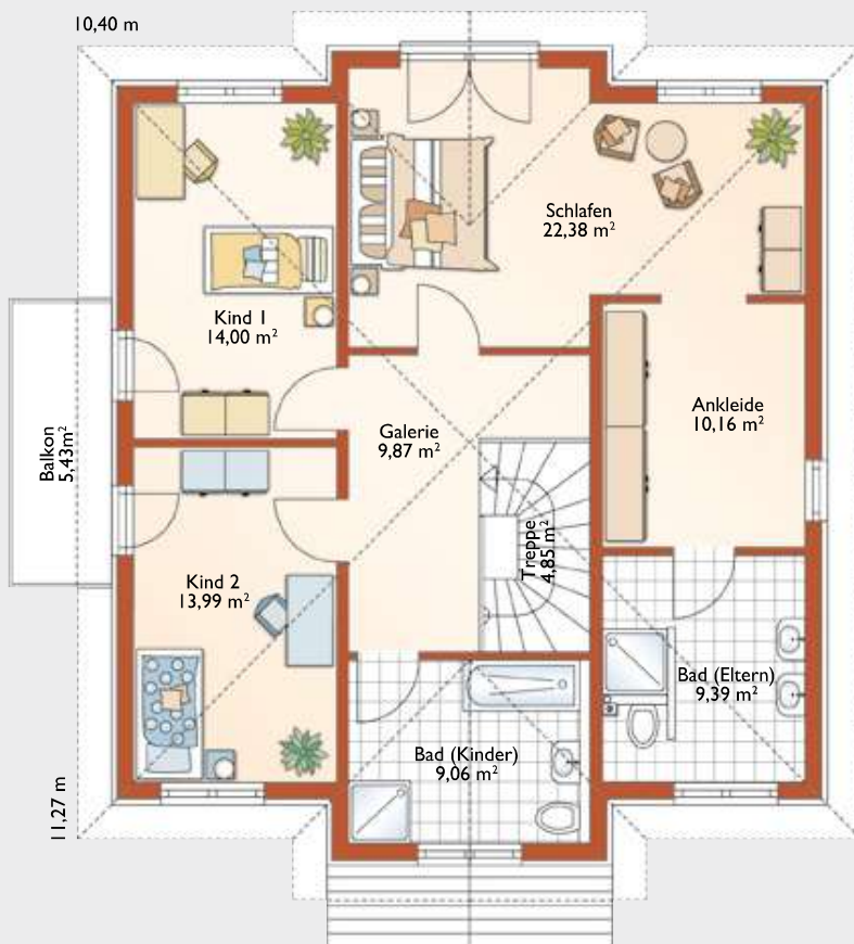
Obergeschoss. Raumgröße gesamt 91,57 m 2

Keller. Fast 95 m 2 bieten hier viel Platz für Hobby, Arbeit und zusätzliche Spielfläche für die Kinder.