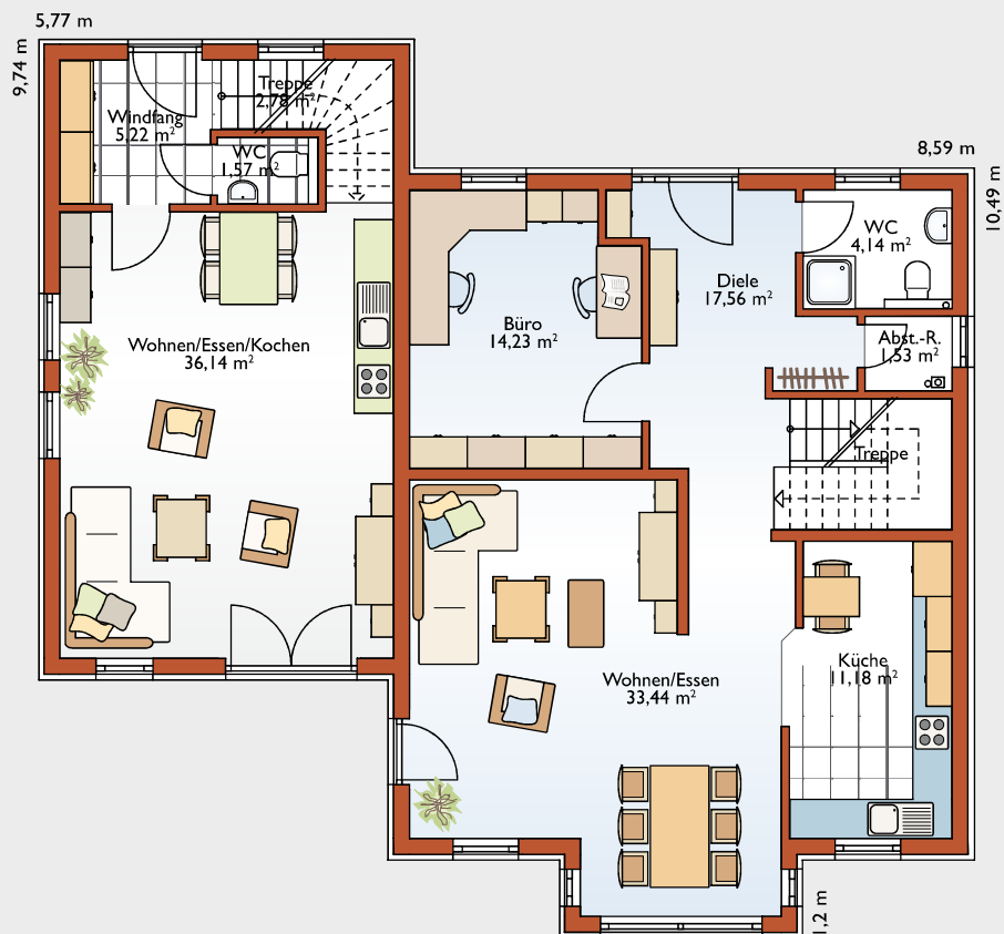
Erdgeschoss. Raumgröße gesamt 127,79 m 2