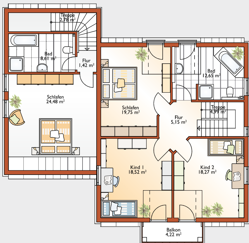
Dachgeschoss. Raumgröße gesamt 110,96 m 2